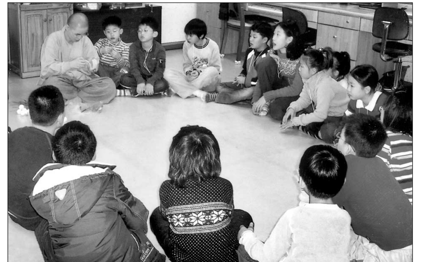
매주 50여명씩 어린이들이 참석하며 성황을 이루는 군포 정각사 어린이법회는 유치원에서부터 초등학교 고학년이 한반이 돼 법회를 진행한다.

또 사찰이 도심 한가운데 위치한 지리적 특성을 어린이법회 운영 프로그램에도 반영했다. 정각사 어린이법회는 첫째주에