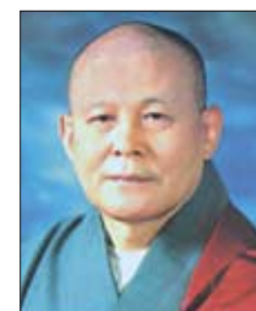
12월 27일(음11월 8일) 지관큰스님 총무원장