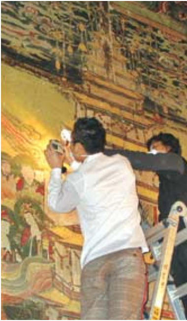
복원에 앞서 3개국 전문가들이 영산전 벽화를 분석하는 장면.

영축총림 통도사주지 지은 영산전의 다보탑 벽화 보존과 모사작업에 한국, 일본, 대만 3국의 문화재 전문가들이 힘을 합쳐 관심이 집중되고 있다.