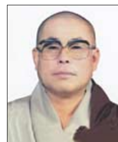
12월 6일(음10월 16일) 월파스님 문수암 주지