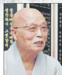
11월 8일(음9월 18일) 보성큰스님 송광사 방장