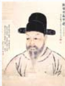
추사 김정희의 제자 허연이 그린 추사의 초상화.

추사체의 대성, 불교, 금석학, 고종학, 실학, 시문학, 문인화의 대가 추사 김정희(1786-1866). 서거 150주년을 맞아 김정희를 새롭게 조명하는 다양한 전시가 열리고 있다.