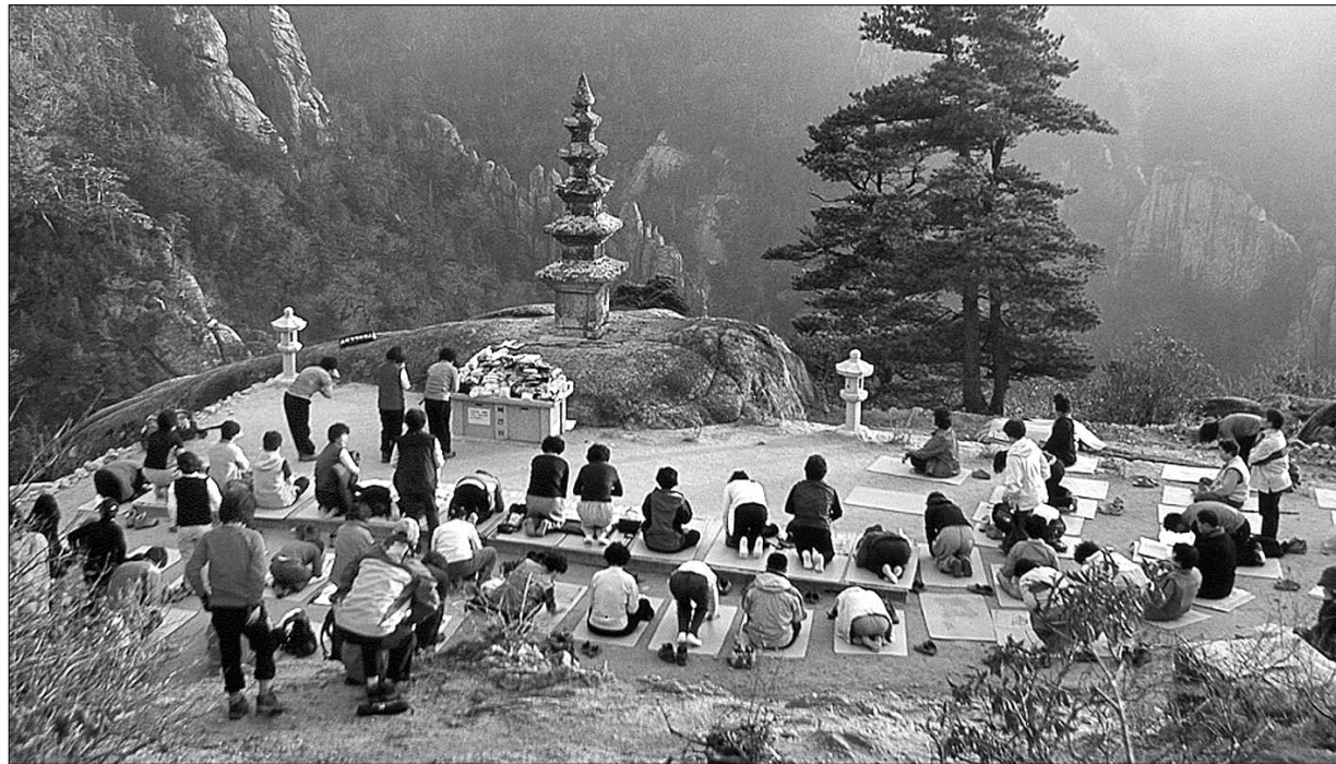
10월 13-14일 봉정암 순례에서 탑 앞에서 절을 하며 발원을 하고 있는 조계사 신도들.

또 원칙을 정해놓고 이를 실천하겠다는 결심도 필요하다. 가족단위의 여행이 늘고 있는 요즘, 계획적인 사찰순례를 하는 것도 좋은 방법이 될 수 있다.