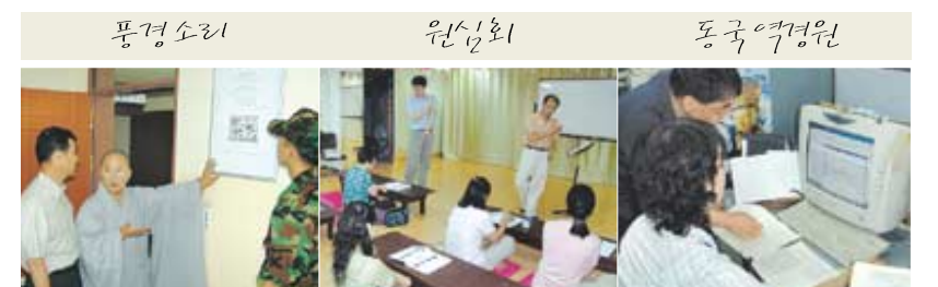
전국 지하철역사에 '자비의 말씀' 설치 | 수화교육·점자 도서 발간 등에 앞장 | 한글대장경 이어 인터넷 불사 '비지담'

이런 현실을 개탄한 원심회는 연중 내내 수화교육을 지도하고 수화강사를 파견하면서 불교계의 유일무이한 봉사단체로 성장했다. 1997년에는 청각장애인을 위해 불교교과 비디오테이프 600개를 제작해 무료 보급했으며 1998년에는 <법화경> 점자도서 및 녹음도서도 발간하는 등 장애인에게 불법을 전하는 일에도 앞장섰다.