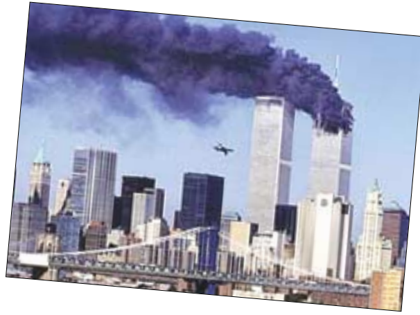
공중납치된 2번째 항공기가 미국 세계무역센터 트윈타워빌딩에 접근하는 장면.