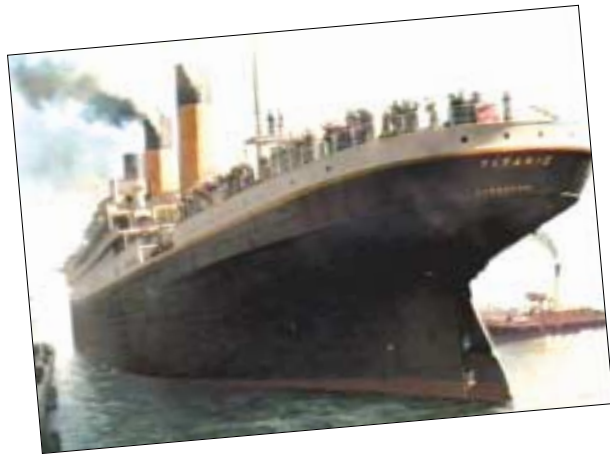
1912년 침몰한 타이타닉호