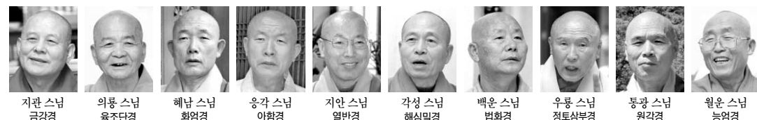
법회 동영상 중계는 bonguns.net과 buddhanews.com에서, 법문 요지는 매주 '현대불교' 24~25면에 소개

봉선사 강설대법회 11월25일 보살계수계법회 031) 527-1951-3