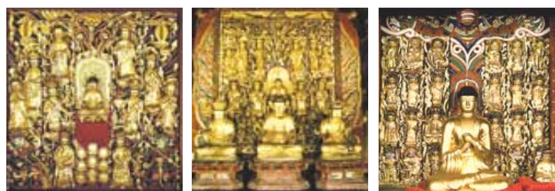
왼쪽부터 차례대로 보물 제748호 서울 경국사 목각탱, 보물 제989호 예천 용문사 목각탱, 보물 제922호 상주 남장사 목각탱.

좌상과 목각탱은 17세기 후반 숙종 10년(1684년)에 조성됐다. 목각탱 하단에 조성된 조각이 남아 있어 제작연도가 확실하다. 현존 목각후불탱 가운데 가장 이른 시기의 작품으로 17세기 후반 조각양식을 알려주는 중요 자료다. 좌상각형의 기본구조 옆에 좌우로 구름 무늬 광선을 표현한 둥근 조각을 붙여 장식한 것이 독특함을 자랑한다. 본존불은 하품중생인의 아미타불임을 묘사하고 있다. 본존불을 둘러싼 사천왕 8대 보살 두 제자는 상중하 3열로 배치됐다. 상열과 중열에는 좌우 두 보살씩 8대 보살을 배치했다. 상열 보살 좌우에는 무릎 꿇고 합장한 2대 제자를 배치해 구도의미를 살린 것이 돋보인다. 하열에는 사천왕상이 일렬로 늘어서 있다.