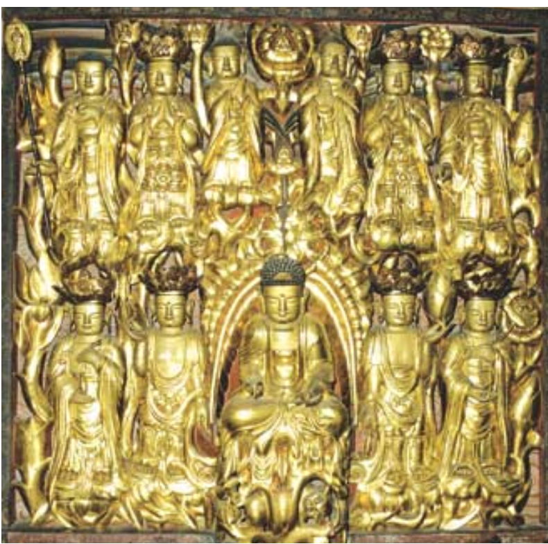
보물 제421호 남원 실상사 약수암 목각탱.