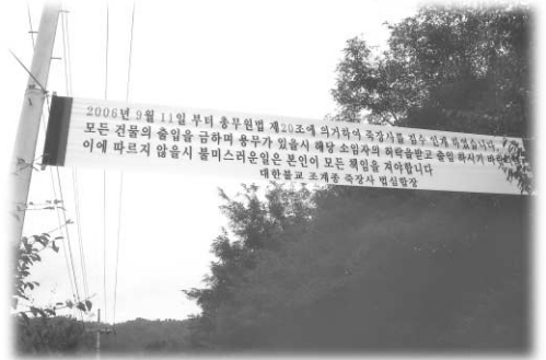
죽장사 입구에 걸려 있는 플래카드