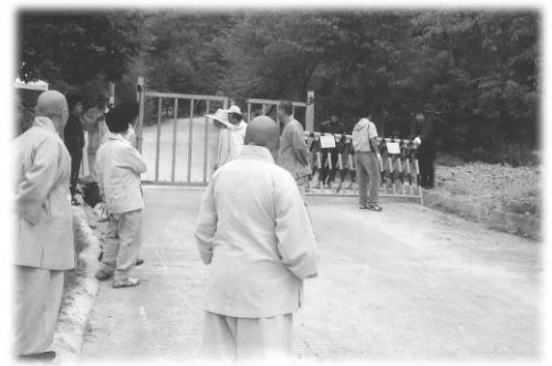
직지사가 임명한 주지 법심스님측에서 죽장사 출입을 통제, 철문을 봉쇄하고 있다. (9월14일 현재)