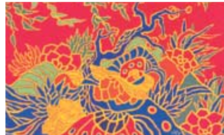
수행하는 틀들이 ‘차 한 잔 마실 시간’ 만큼 투자해 그려낸 스님의 작품들은 선화의 또다른 모습이다.

그동안 그려왔던 선화의 단조로움을 벗어나 복잡한 선들을 물 흐르듯 그려냈다. 마음가는데로 흐르는 선 위에 마치 단정처럼 강렬한 색상을 덧입혔다. 스님