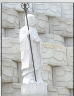
육지장보살 형 (연화대 하단 안치)

자화사리를 아이티 부처님 · 지장보살님 복제품에 직접 안치합니다. 부처님, 보살님께서 조상님들 양왕이 꿈에 안고 계십니다.