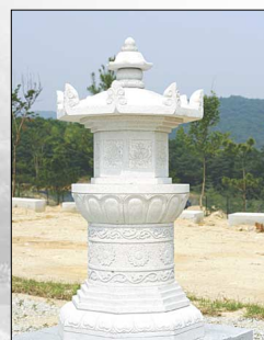
부도탑 형 (연화대 하단 위치)

중생들 6도의 윤회에서 구제하여 극락세계로 이끌어 주시는 지장보살님께 진족·가족을 함께 안치할 수 있습니다. • 안치능력: 가족 문중 가능 • 높이: 210 Cm • 재질: 천연화강암 • 특징: 연꽃 무늬난에 입구를 통해 평안