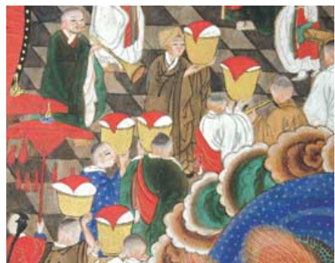
그림2: 입장하는 성반(盛飯)

그리하여 부처님의 설법을 ‘감로의 법문(法門)’이라고 하기도 하고 이 법문의 재비로움을 ‘감로의 법