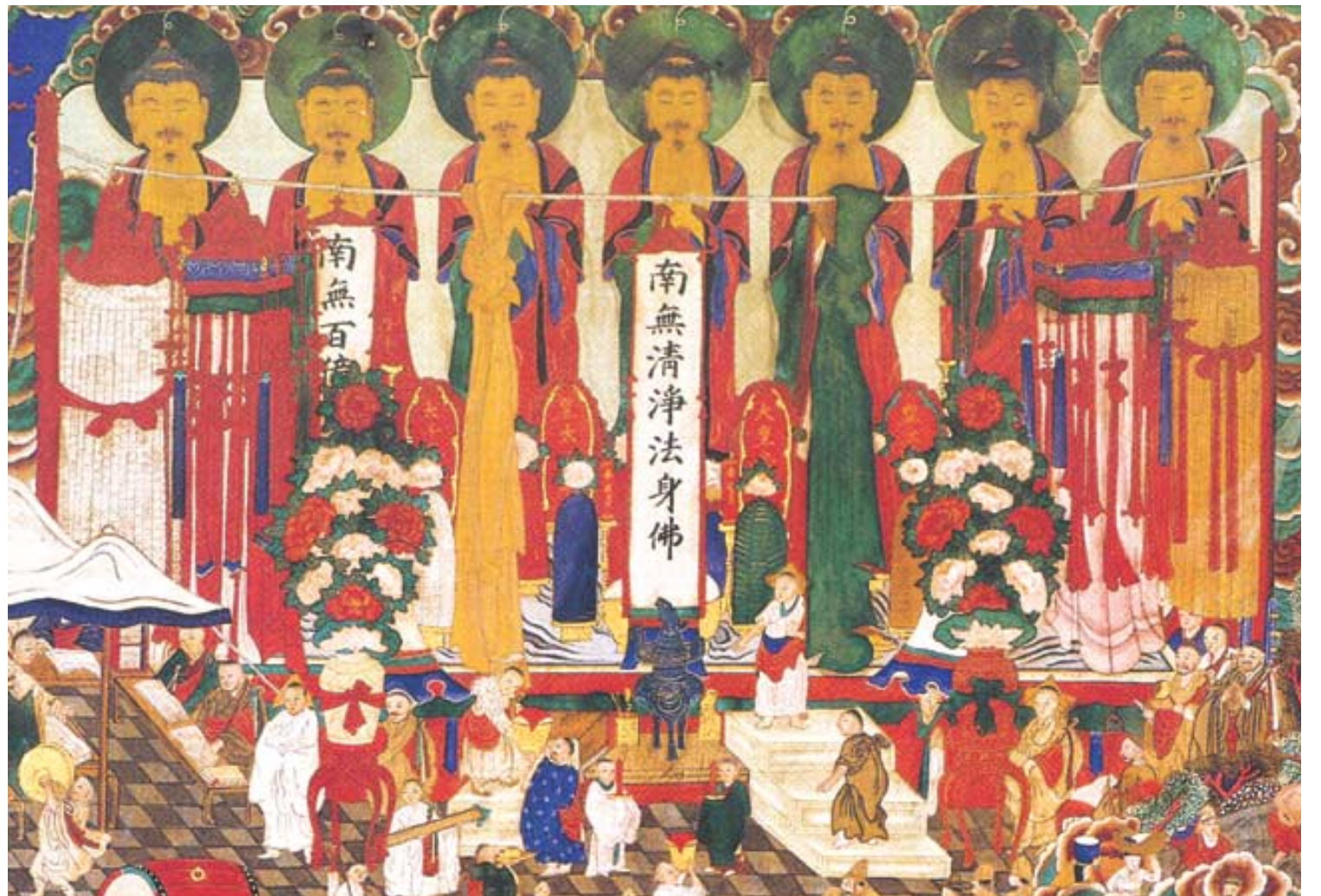
그림3: 보광사 감로탱의 부분, 칠여래와 치러지는 사식단

우(法雨)’라고도 하지요. 석가모니가 득도 후, 고심 끝에 깨달은 바를 설법하기로 결심하고 마침내 한 말은 “내 이제 감로(甘露)의 문을 여니나, 귀 있는 자들라, 낡은 믿음을 버리고”였습니다. 이 당당한 말씀. 그는 자신의 설법으로 ‘감로의 문’을 연다고 했습니다. 고통 속 중생의 영혼을 구제할 수 있다는 지극한 확신이 느껴집니다. 가는 여름이 아쉬워 서울 근교로 나가 파주 보광사(寶光寺)에 들렀습니다. 대웅보전 안의 좌측 영단(靈壇)에는 밝고 원색적인 색감이 아직도 그대로 살아