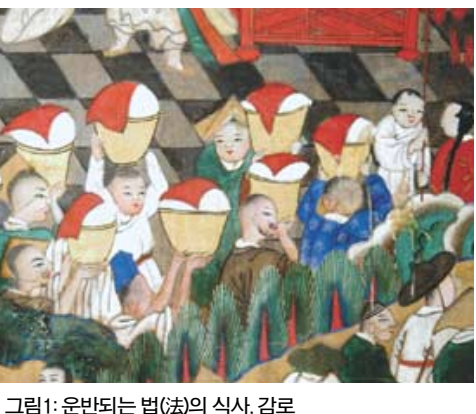
그림1: 운반되는 법(法)의 식사, 감로

대의 19세기말 작품(봉은사감로탱, 삼각산 청룡사감로탱, 백련사감로탱 등)에 공통적으로 나타나, 하나의 초본(불화의 밑그림)이 당시 서울 경기 지역을 중심으로 유행했다는 것을 알 수 있습니다. 다 차려진 제단이 있는 감로탱보다 이러한 형식의 감로탱은, 작품에 묘한 다이나믹함을 더하고 마치 현장 생중계를 보는듯한 생생한 활력감을 부여합니다. 이 새로운 형식의 감로탱을 장안해낸 화사(畫師)의 창의력이 돋보입니다. 운반되어오는 이 법(法)의 식사(즉 감로)는, 물론 우선적으로 우리의 육체적 허기를 채우기 위함이지만, 궁극적으로는 우리의 정신적 허기를 채우기 위한 방편(方便)입니다. “먼저 맛있는 음식으로 굶주림을 달래게 하고, 그 다음엔 참다운 진리의 기쁨을 맛보게 하리라”라는 약사여래의 12대원 중 한 서원(誓願)도 그 의미가 일맥상통하는군요. 즉 ‘참다운 진리의 기쁨의 맛’이란, 법희식(法喜食) 선열식(禪悅食)을 말하는 것이겠지요. 끊임없는 욕망으로 항상 굶주려있는 우리의 허기를 채워줄 수 있는 ‘궁극의 만찬’은 바로 이 ‘감로’ 일까요. (계속) 강산연(미술사학자 · 홍익대 겸임교수)