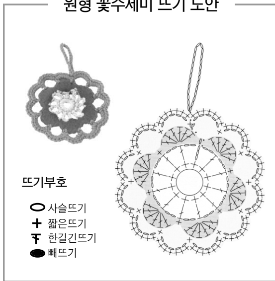
원형 꽃수세미 뜨기 도안

어떠세요? 만능 살림꾼인 저를 한 번 만들어 보고 싶지 않으세요? 제가 살짜 노하우를 알려 드릴게요. 우선, 색색의 아크릴사와 코바늘을 준비하세요. 아크릴사는 50g 한 봉지에 1000~1500원, 코바늘은 크기에 따라 500~1000원이면 살 수 있어요. 50g 실 한 봉지엔 수세미 3~4개는 넉넉히 만들 수 있습니다. 요즘은 다양한 도안이 나와서 꽃잎 모양이나 동물, 과일 모양 수세미 친구들도 있어요. 이 친구들은 너무 예뻐서 부엌이나 욕실에 걸어놓으면 장식도 됩니다. 코바늘뜨기가 서툴다면 그냥 동그라미나 네모 모양으로 뜨도 좋아요. 수세미는 조금 성글게 짜야 손에 쏙 끼여지고 음식물 찌꺼기도 끼지 않아요. 잘라 고리 만드는 것도 잊지 마세요. 사용 후 물기가 잘 빠지도록 걸어서 말려야 하거든요. 코바늘뜨기를 못 하신다고요? 요즘은 동네 수예품점이나 한