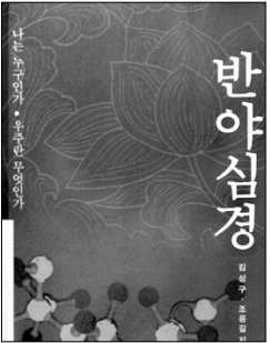
현대물리학으로 풀어본 반야심경 김성구 · 조용길 지음 불광출판부 | 9000원

반야부 경전 가운데서 가장 간명하고 반야의 핵심을 담은 요전인 <반야심경>. <반야심경>은 불교의 근본 사상이니 연기를 공(空) 사상의 관점에서 서술하여 '나는 누구인가, 우주란 무엇인가'에 대한 근원적인 화두의 답을 제시하고 있다. 그래서 <반야심경>은 부처님이 본 진리중 핵심만 골라 압축한 경전이라고 한다.