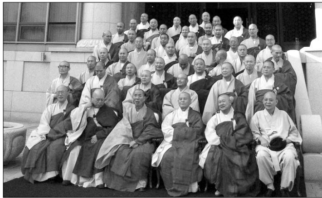
조계종 13대 중앙종회가 9월 5일 17회 회의로 사실상 마감됐다. 13대 중앙종회는 지난 4년간 갈수록 정치화 되어가는 중앙종회의 한계를 극명하게 보여줬다.

번의 회의를 열었다. 총 125일의 회기 가운데 55일(44%)만 개의되고 대부분은 회기를 단축한 채 폐회했다. 그나마 156, 159, 168회는 성원 미달로 개최도 못하고 유회했다. 출석률은 평균 70%를 밑돌았다. 4년 동안 사무처로 접수돼 종회에서 논의한 안건은 모두 230건, 이 가운데 210개 안건이 상정됐다. 12대 중앙종회에서 457건이 상정된 것과 비교하면 안건을 사전에 심사하는 상임위의 역할이 강화된 측면이 있다. 이 가운데 순수한 법안 처리는 83건이 제출됐고 고작 14건(17%)만 가결됐다. 그나마 의원발의로 처리된 안건은 단 1건에 그쳤고, 대부분 원안을 수정하거나 철삭해 원래의 입법취지를 훼손하는 경우가 빈번했던 것도 문제로 지적되고 있다.