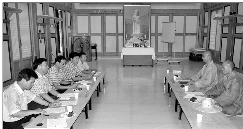
대구 경북지역 5개 교구 본사 포교국장 스님들과 대구경북 포교사단이 8월 29일 모임을 갖고 '포교'라는 공동 목표를 향해 나아가기를 서원했다.

모임에서 선용 스님은 "신입포교사의 품수를 앞두고 소견서를 작성하는 과정에서 타 지역에서 배출된 포교사가 상당수 있는 것을 보고 이는 대구경북 5개교구가 함께 고민해야 하는 부분이라는 생