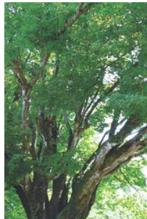
내장사는 일주문서 사천왕문까지 108 단풍터널을 이룬다.