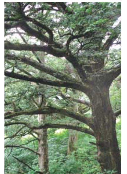
수령 6백년 정도되는 보물급 노거수 비자나무.