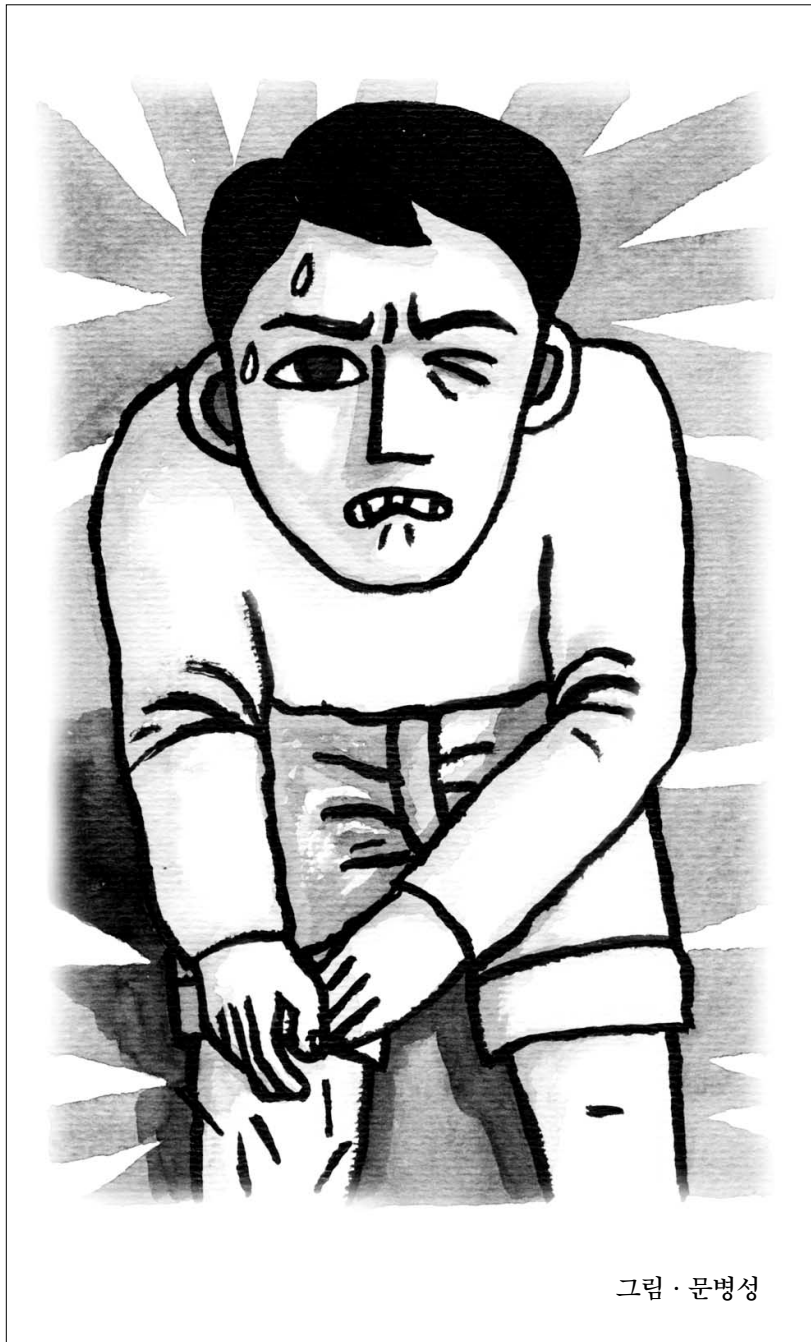
그림 · 문병성

일주일 사이의 생활은 매우 한차레씩의 설법과 철야정진을 반복하면서 그럭저럭 평온을 찾아가는 듯하였으나, 일 년의 사이클에서는 여름 겨울 두 번의 용맹정진이 분수령이다.