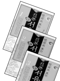
만화로 보는 진본서유기 1~3권 오승은 저음 | 조태호 그림 맑은소리 | 9800원