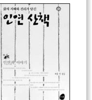
인연산책 서문성 저음 | 9,000원

■ 인연 산책 (서문성 저음, 미래북) = 미리 정해진 업을 면할 수 없다면 어찌해야 되는가, 그대로 앉아서 받기만을 기다려야 하는가, 혹은 다른 방법은 없는가, 하는 의문에 대한 인과야기들이다. 지금 나의 마음가짐, 말, 행동 하나하나가 모두 인이 되어 어떤 연을 만나게 되면 상응하는 결과가 나타나게 된다. 업(業)과 인연(因緣)을 주제로 불교의 가르침과 삶의 지혜를 알려주는 철학들을 선별하여 엮었다. 과거 고승을 이야기와 예화들을 들려주고 그로부터 업과 인연, 그리고 인과가 무엇인지, 그리고 이를 어떻게 받아들여야 하는지를 설명해 준다.