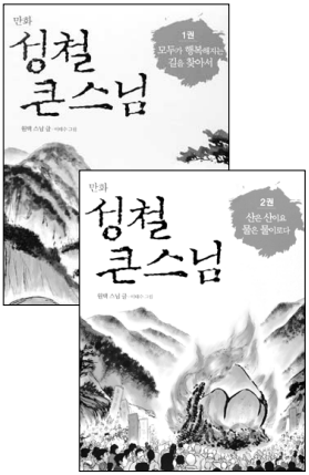
성철 큰스님 1·2권 모두가 행복해지는 길을 찾아서 원택 스님 엮음 | 이태수 그림 일러스트 | 9800원

출생부터 열반까지 쉽고 재미있게 만화로 엮어 유별난 책사랑·출가 계기가 된 책 이야기 ‘눈길’