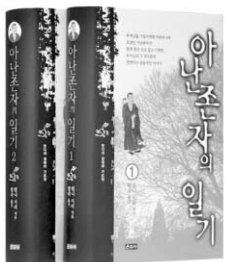
아난존자의 일기 1·2권 원나사리 저음 범라스님 역 운주사 | 2만18000원

석가모니 부처님을 25년간 시봉하여 불경을 기록하는데 가장 현명한 공로를 세운 아난존자. 부처님의 10대 제자이며 속가 사촌동생이기도 했던 아난존자는 유독 연민과 자비심이 많아 인간적 체취가 물씬 풍기는 수행자였다. 이 책은 아난존자의 출가 전후의 수행 및 부처님 시봉 생활, 그리고 경전 결집과 깨달음의 과정을 그렸다. 즉 아난존자가 열반에 들 때까지 일생동안 보고, 듣고, 배우고, 느낀 바를 기록하는 형식으로 이루어진 일기의 기록이다. 이 책은 부처님의 생애와 가르침, 그리고 제자들의 수행을 일기라는 형식으로 드러내고 있는 독특한 책이다. 이 책 읽으면 부처님 일생은 물론이요, 부처님 주변 인물들의 가슴 뭉클한 삶을 구석구석 여행할 수 있다. 원래 2000년에 발간된 이 책은 이번에 개정되면서 총 4권에서 2권으로 묶였다. 저자 원나사리 스님은 미얀마 불교의 종교성 원로회의에서 한동안 활동하였으며, 여러 불교 잡지에 활발한 기고활동을 하였다. 아담답고 간결한 문체로 부처님의 가르침을 일반인들에게 알기 쉽게 전달하는 집필활동에 전념하고 있다.