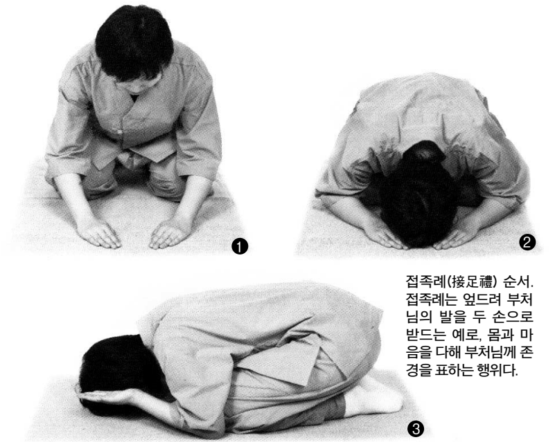
접족례(接足禮) 순서. 접족례는 엄두 부처님의 발을 두 손으로 받드는 예로, 몸과 마음을 다해 부처님께 존경을 표하는 행위다.

법당에서 대중들과 함께 할 때는 삼귀의례→경전봉독→참회발원→절 수행→좌선→회향 발원→사홍서원 순서로, 집에서 절하는 경우는 주년 정돈→환 피우고 마음 다지기→삼귀의례→참회 발원→절 수행→좌선→회향 발원→사홍서원