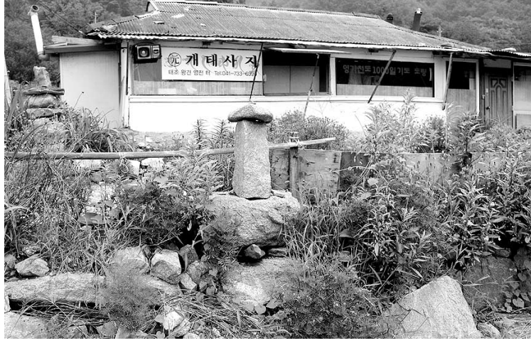
충청남도 기념물 제44호로 지정된 개태사지 내에서 불법으로 건물을 증축하고 주변의 주춧돌로 탑과 축대를 쌓아 사지지를 훼손한 '왕건영전 개태사지' 모습.

즉시(강제) 이주와 가옥의 즉시(강제) 철거가 원칙이지만 당시 도의적인 차원에서 행정대집행을 할 수 없었다"며 "조속히 이주통고 공문을 발송해 이주를 유도해 나가겠다"고 밝혔다.