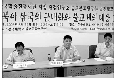
국학진흥원재단 지정 중점연구소 불교문화연구원 중장발표회 '동북아 삼국의 근대화와 불교계의 대응'

“일제가 한국불교를 행정적으로 통제·관리하기 위해 1911년에 제정·시행한 사찰령 속에서 당시의 불교계는 이를 적극적으로 저항하지 않고 오히려 그것을 인정하고 그 선상에서 불교 발전과 종단의 근대화를 추진했다.”