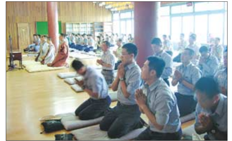
해군교육사령부 군법당은 매주 1000여명의 장교 및 사병 불자가 법회에 동참하는 등 해군 포교의 전진 기지 역할을 하고 있다. 사진은 영의 법당인 흥국사에서 8월 20일 일요일법회를 봉행하는 모습.

영내에 있어 일반인들의 출입이 자유롭지 못해 부대 안에 사람이 있는지도 모를 정도로 지역 불자들에게 알려지지 않