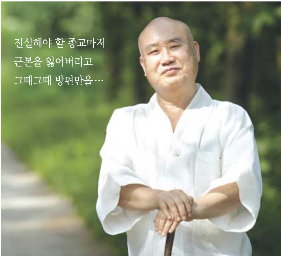
진실해야 할 종교마저 근본을 잃어버리고 그때그때 방편만을...