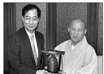
대통령직속 한미 FTA체결 지원 위원회 한덕수(경제부총리) 위원장이 8월 22일 오후 3시 조계종 총무원장 지관 스님을 예방해 한미FTA 체결에 대한 종교계의 지원을 부탁