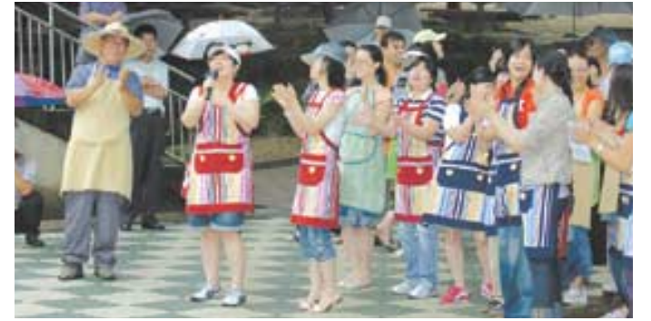
토요나눔마당 자원봉사자들이 노인들을 위해 노래를 부르고 있다.