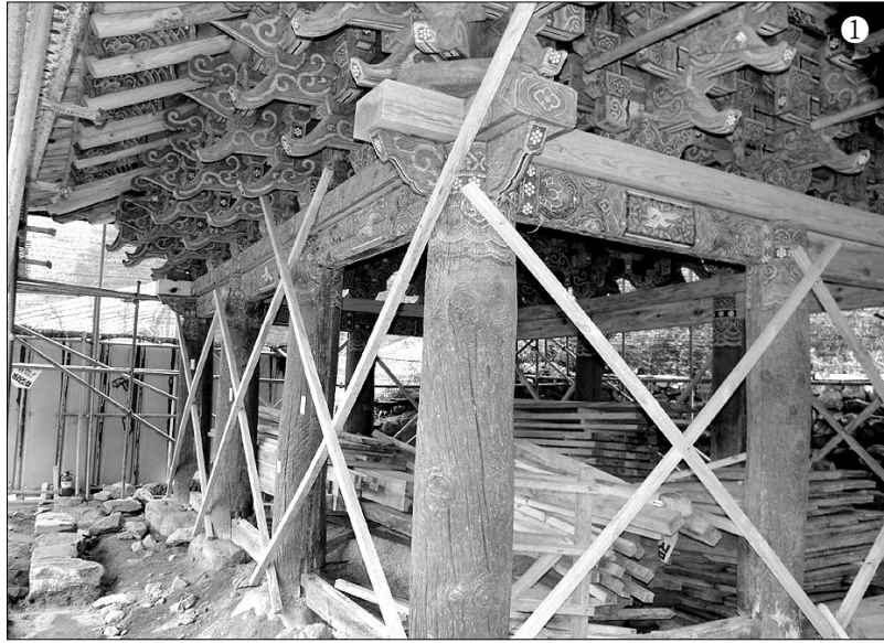
① '80%이상 공사가 완료됐다'고 말하는 안성시 관계자의 말이 무색할 정도로 공사자재로 가득 채워진 안성 석남사 영산전 내부 ② 석남사 한 귀퉁이에 쌓여있는 영산전 벽면조각과 깨진 기와조각 ③가설 덧집으로 덮인 영산전의 모습

그리고 2003년 10월부터 영산전 해체보수공사가 진행됐다. 그 후 안성시는 2년이 지나고 나서야 추경예산을 통해 문화재청으로부터 2억원의 긴급보수 지원에