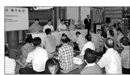
호남지역에는 최초로 8월 11일 광주 원각사에서 재가논강이 열렸다.

끝으로 김 교수는 "보시바라밀의 실천은 개인적 차원에서는 복덕과 지혜를 구축하기 위한 실천행이지만 사회적 차원에서는 불교도를 만들어 가는 초석을 놓는 것이 된다. 보시바라밀의 주체는 불사이지만 그 장은 사찰이 되어 그것을 사회적으로 환원하는 역할을 해주어야 한다. 그러한 점에서 사찰의 사회복지활동이 활발해지면