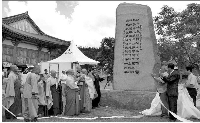
8월 11일 제주 법화사에서 열린 서옹 스님의 선시비 제막식.

주지 시공 스님은 인사말을 통해 "1983년 탄허 스님이 시를 짓고 소암 선생이 글씨를 써 전시회를 개최한 것이 법화사 중창불사의 토대가 됐다"고 회고하고, "제주와 인연 있는 큰 스님들의 가르침을 잊지 않도록 하기 위해 시비를 제작한다"고 말했다.