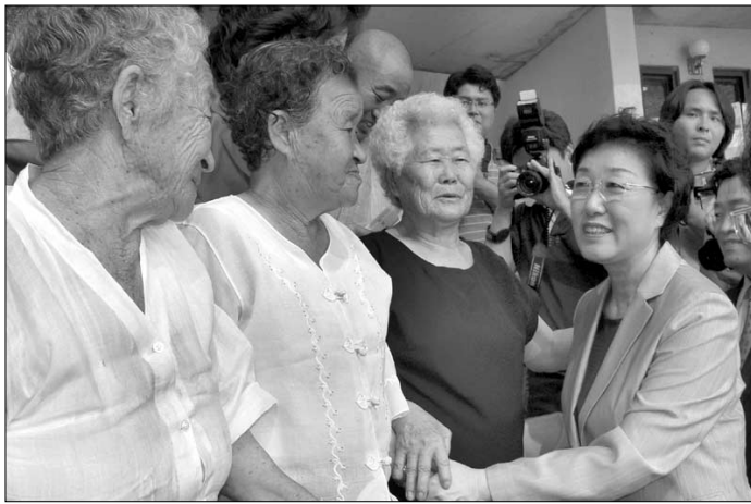
한명숙 국무총리가 위안부 할머니들을 만나기 위해 8월 14일 나눔의 집을 방문했다.