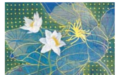
큰 연꽃이 작은 연꽃을 감싸는 형태로 표현된 김나현씨의 채색화 ‘연꽃’.