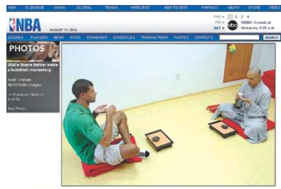
미국 프로농구 NBA 공식 홈페이지(nba.com)에 실린 선업 스님과 배티어의 차담 사진.

나중에 개인적으로 다시 봉은사를 찾아 참선을 배우고 싶다는 배티어 선수는 이미 지난 2000년 팬들과의 인터뷰에서 "불교에 상당한 관심이 있고 '선(禪) 사상'은 농구를 하는 데 큰 도움을 준다"며 "농구와 학업 모두 강한 의지와 평정심을 지녀야 한다는 것과 너무 과하거나 모자라서는 안 되는 중도를 걸어야 한다는 공명점을 지니고 있는데 이것이 바로 불교의 사상"이라고 밝히는 등 불교에 대한 관심을 표현해왔다. 영화를 좋아하는 어머니가 가장 좋아하는 영화 '세인'을 본따 이름이 세인이 됐다는 배티어 선수는 어머니도 역시 불교에 관심이 많다는 말도 전했다. 배티어 선수가 특별히 봉은사를 찾은 이유는 숙소인 서울 삼성동 코엑스 인터콘티넨탈 호텔에서 절이 보였기 때문이다. 마음의 평정을 유지하는 것에 관심이 많은 배티어 선수에게 참선은 최고의 마음 평정법이었던 것. 배티어 선수는 경기를 앞두고 무작정 봉은사로 발길을 옮겼다. 봉은사를 방문하고 싶어한 동료들이 많았지만 시간이 맞지 않아 못한 것을 아쉬워 했다는 후문이다.