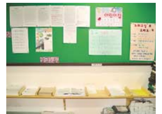
깔끔하게 정리된 대구 영남불교대학 관음사의 게시판.