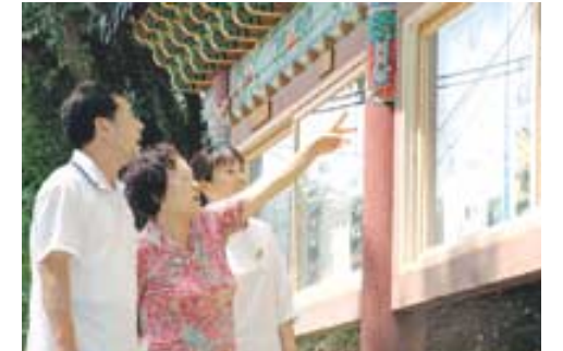
봉선사를 찾은 불자들이 게시판을 유심히 살펴보고 있다.

광주 중심사(주지 진화)가 지리한 무등산은 하루 수만 명의 시민이 찾는 명산이다. 중심사 종무소앞에 아담하게 꾸며진 게시판을 등산객과 시민들이 피해갈 수 없는 명소다. 깔끔하게 단장돼 한번 더 눈길 가는 게시판은 사찰행사 안내뿐 아니라 삭막한 현대인의 마음을 정화하는 법구(法句)들을 선보여 무등산을 찾는 이들의 마음의 쉼터가 되고 있다. 서울 화계사(주지 수경도) 최근, 신도들이 불교정보를 손쉽게 접할 수 있도록 대형 간행물 비치대를 종무소 앞에 새롭게 설치했다. '현대 불교'를 비롯한 각종 불교계 신문은 물론 사보와 불교단체들이 발행하는 회보 등을 가지런히 배례해 한곳에서 다양한 정보와 뉴스를 접할 수 있도록 한 것. 사찰의 입구에서 그 절의 '얼굴' 역할을 하는 게시판을 활용여하에 따라 무궁무진한 매력을 발휘할 수 있다. 부임하면서 게시판 정비부터 했다는 봉선사 주지 월안 스님은 "인터넷이나 사보 발행과는 비교할 수 없을만큼 적은 비용과 노력으로도 얼마든지 활용할 수 있는 게시판에 관심을 가져야 한다"고 강조한다.