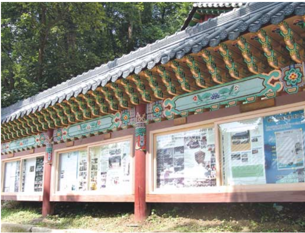
고풍스런 전통건축양식을 지닌 외형에 사찰은 물론 지역의 소식까지 알려주는 남양주 봉선사의 대형 게시판. 그 자체로 명물이다.