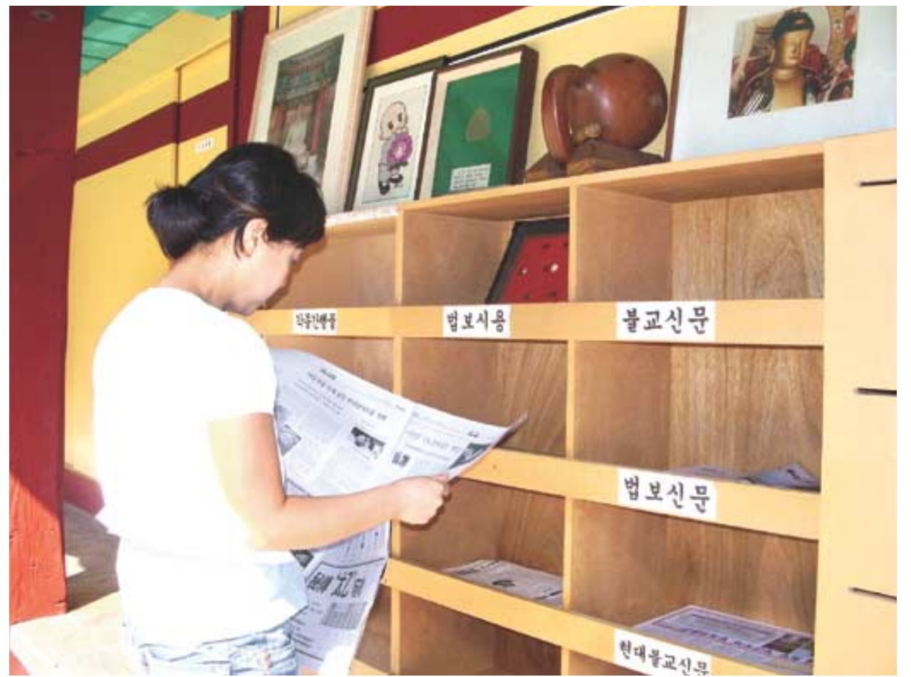
서울 화계사는 최근 깔끔한 간행물 비치대를 설치해 한곳에서 일목요연하게 불교정보를 접할 수 있게 배려했다.