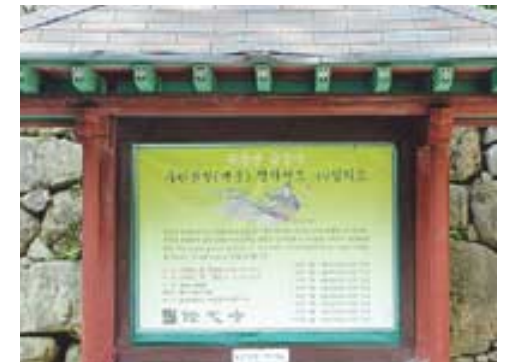
광주 중심사는 게시판을 활용해 무등산을 찾는 시민들에게 삶의 길로수학도 같은 법구를 들려주고 있다.