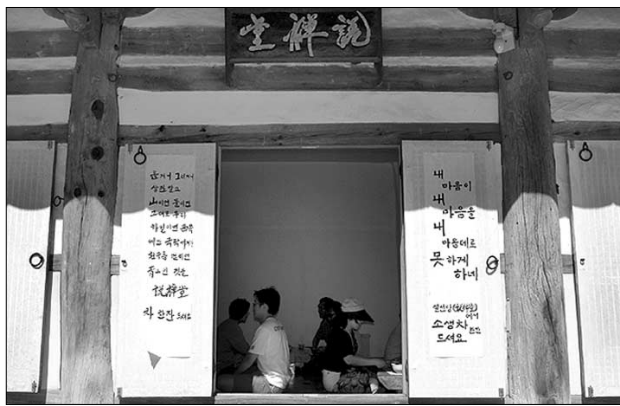
내소사 무료다원에는 매일 100여명이 차를 마시고 간다.