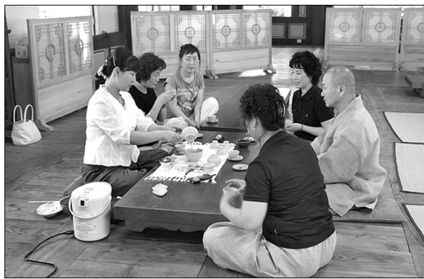
50여명이 함께 차를 마실 수 있는 증심사 자향다실에는 서적도 비치돼 있다.