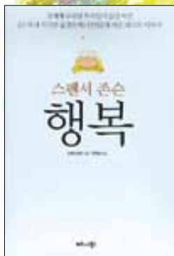
행복 스펜서 존슨 비즈니스북스 1만원