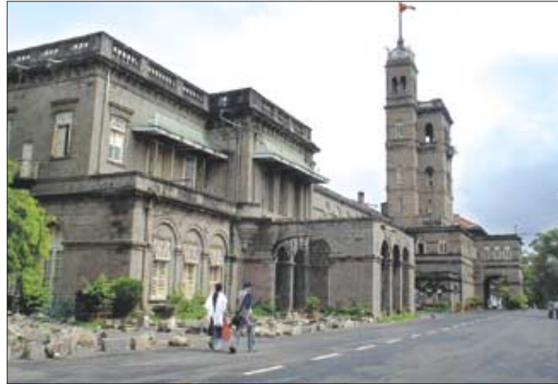
뿌네대학 전경. 뿌네대학은 올해부터 빠알리어학과와 불교학을 신설해 불교학 활성화에 나선다.

지금까지 빠알리어는 산스크리트어와 지방언어과에 포함된 형태로 강의가 이뤄졌었다. 여기에 불교학과가 신설되면