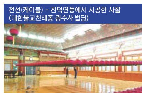
전선(케이블) - 찬덕연등에서 시공한 사찰 (대한불교천태종 광수사 법당)

찬덕연등에서는 KS케이블을 사용하여 가장 안전하게 전문 기술인에 의해 직접 감독 시공합니다.