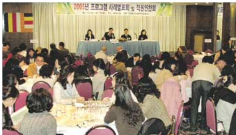
부산의 불국도복지관 봉사자들은 '부산불교사회복지·청소년기관협의회'를 만들어 상호간 정보공유와 경쟁을 통한 발전방안을 모색하고 있다. 사진은 부산불교사회복지기관협의회 주최의 2005년 프로그램 사례발표회 및 직원 연찬회.

있는 범어사가 사회복지법인 범어사를 설립하여 금정구복지관과 화명복지관을, 진각복지재단에서 낙동복지관을, 공덕향법원에서 공창복지관을 사회복지법인 불국도에서 용호복지관을 추가로 수탁하여 지역주민들을 위한 이용 복지시설로서의 역할을 다하고 있다.