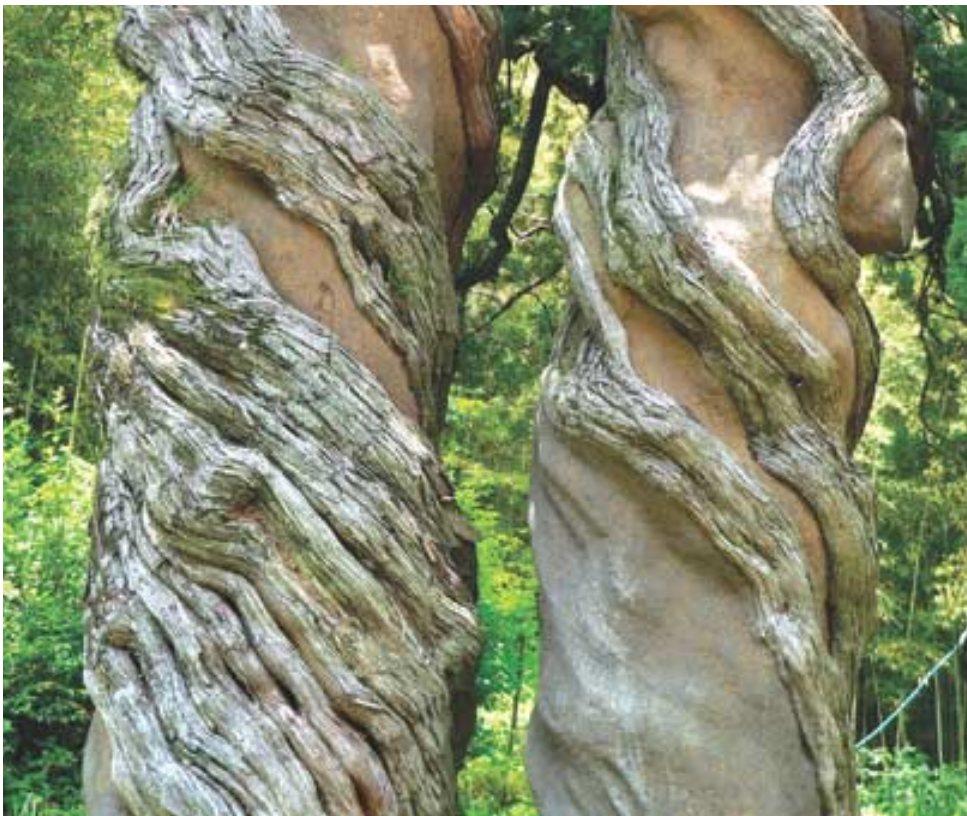
보조국사와 담당국사가 짚고 다니던 지팡이가 지켰다는 송광사 천자암 앞의 곱향나무(쌍향수).