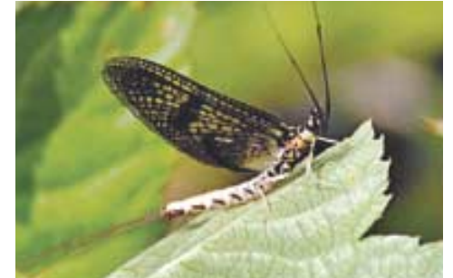
하루살이는 송광사 생태계의 중요한 지표종이다.