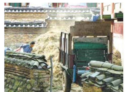
송광사 해우소 매질.