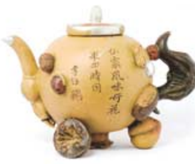
갤러리 루브가 7월 30일까지 개최하는 '청대 다도구 명품전'에 선보이는 찻잔(위)과 자사호

100여 점이 소개된다. 특히 청대 초의 유명한 자사 작가인 해맹신(海孟臣, 1598-1684)의 자사호도 공개될 예정이다. 눈길을 끈다. 27일 오후 3시에는 '오래된 다도구로 마셔보는 보이차 시음회'도 열린다. 시음회에서 자사호와 보이차에 설명도 함께 들을 수 있다. (02)3478-0815