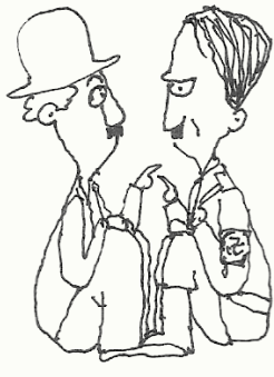
눈을 보고 말하는 것은 맞춤형 연속해서 눈과 눈을 마주치는 시간은 1초이다. 그 이상 마주치면 스트레스가 생긴다.