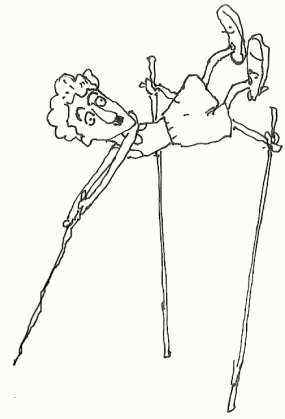
오버액션은 경박하다 무조건 타인의 시선을 끌어 모으려고 하는 사람은 승부에 약한 사람이다.