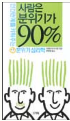
사람은 분위기가 90% 다케우치이치로 지음 수화제 | 8800원

여성의 거짓말을 간파하기 어려운 이유는 무엇일까? 소파의 틈새가 기분을 편안하게 만들어주는 것은 왜일까? 남자 화장실에서 가장 인기 있는 자리는 어디일까?