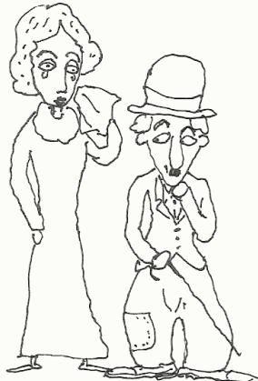
적은 눈동자를 조심하라 적은 눈동자는 상대를 포로로 만든다.