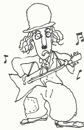
관객은 교류하고 싶어한다 대화란 상대를 제압하는 것이 아니다. 쌍방이 서로 교류하는 것이다.