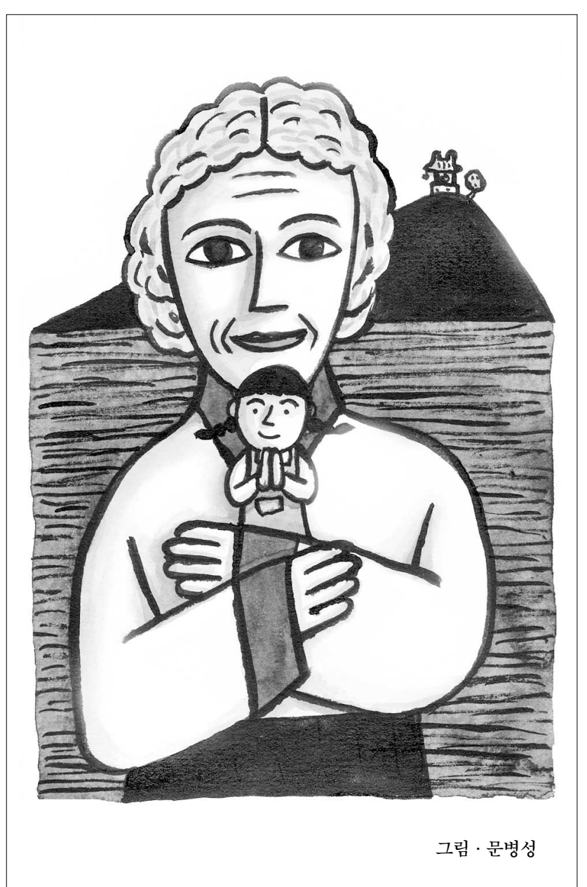
그림 · 문병성

어머니가 명절에 손님들을 위해 고품을 준비하고 갈비찜을 준비할 때면 난 성질을 부리며 짜증을 많이 냈다. 난 먹지도 않는 데 이 싫은 냄새를 맡아야 하고 찜통은 옮겨야 하며 성질을 부렸다. (계속)