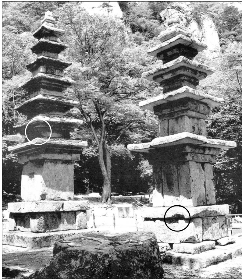
기단부 파손이심 및 벽각(사진 오른쪽 원안), 2층 옥개석의 부재결실과 표면요철(사진 왼쪽 원안) 등 당국의 관리소홀로 모습을 잃고 있는 공주 청량사지 5·7층 석탑.

국립문화재연구소 김진형 연구원은 “1996년 감은사터 동탑을 해체 보수했지만 기반부 아래에 잡석을 부실하게 채워 기반부가 불안정해지는 결과를 초래했다”며 “1000년 이상 안정적으로 버티오던 석조물을 해체하는 것은 예기치 못한