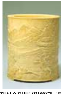
중국 청대에 제작된 '상아제산수필통(원곡)과 분채연담초문쌍이병'