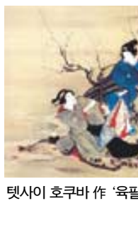
텍사이 호쿠바 작 '육필 우키묘에 미인도'