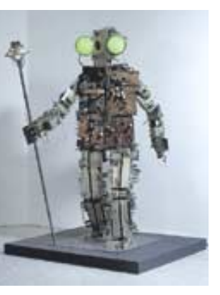
국내 첫 선을 보이는 '스키타이왕 단군'

이번 전시는 기계와 자연이 동화하고 삶과 죽음이 연결돼 있다는 불교적 세계관을 작품 속에 담아냈던 백남준 선생을 기리며 생명의 탄생과 소멸, 그리고 그 이후라는 이야기 속으로 관람객들을 끌어들이는. 매일 오후 1시30분에는 문화예술 작품 전문 설명인 도슨트가 50여분간 작품들을 설명해준다. (02)2014-6901 김지연 기자