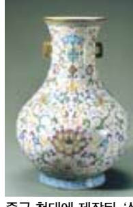
중국 청대에 제작된 '상아제산수필통(원곡)과 분채연담초문쌍이병'