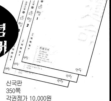
신국판 350쪽 각권정가 10,000원

전집구입시 15,000원 후불제! (062)266-1083, 266-6693 으로 전화주시면 책 먼저 보내드립니다! 입금계좌:(예금주:오희규) 농협 601175-52-016521