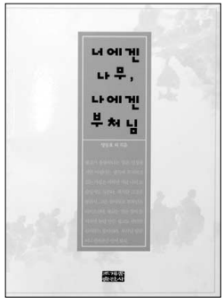
내에겐 나무, 내에겐 부처님 양동호의 지음 조계종출판사 | 8000원

“불교는 제멋대로 이리저리 나아가는 생각들에게 ‘이것이 바른길’이라는 이정표를 제시할 뿐이다. 멈추지 않으면 후회로 끝나는 물라두 누구나 그 궁극에 이를 수밖에 없다.”