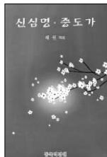
신심명·증도가 해원 역해 동국역경원 8000원

이 책의 구성은 총 5부, 66편. 이전 책에서는 선보이지 않았던 스님의 시들도 아름다운 풍경사진과 함께 아름다운 지면을 장식한다.