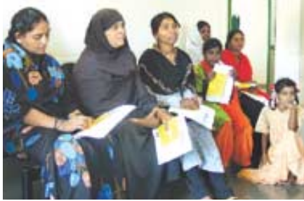
가덴장세 승가대학 부속병원에서 침술진료를 기다리고 있는 마을 사람들