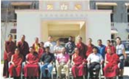
가덴장세 승가대학 부속병원 앞에서 대학병원 관계자와 '와사' 회원들이 기념촬영한 모습

한국 불자들이 풀뿌리처럼 연계해서 티베트와 실질적이고 효과적인 교류를 갖자는 목적으로 개인과 개인, 단체와 단체, 개인과 단체간에 다양한 인연을 맺는 한국-티베트 풀뿌리운동.