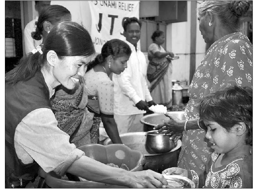
JTS 봉사자들이 지난해 1월 쓰나미 피해를 입은 인도 타밀주에 긴급피견대 구호활동을 펼치고 있다.

“남이 하니까 나도 한다”는 식이거나, 큰 그림을 갖고 교류를 가지지 못한 탓이다. 이에 따라 사찰간 교류를 위한 교육과 안내, 지도 등을 종합적으로 관리할 수 있는 ‘교류센터’를 종단내에 설치해야 한다는 의견도 제시되고 있다.