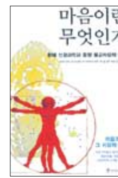
마음이란 무엇인가 달라이라마와 지음 세이츠를리는사람 1만2800원

1부 '몸의 윤리학: 몸이 가르치는 것'에서는 마음을 바라보는 동서양의 각기 다른 관점이 인류의 보편적 윤리 기반이 될 수 있는지에 대한 분석이 이루어진다. 고통을 주고 기운을 돌우는 감정이 건강에 미치는 영향에 대해 얘기한 부분은 흥미롭다. 2부 '생물학적 근거: 마음이 몸을 치유한다'는 두뇌로부터 독립된 의식이란 과연 존재할 수 있는지에 대해 달라이 라마와 신경과학자들 사이에 팽팽한 논쟁이 이어진다. 3부 '의학과 효과적인 방법: 현대 과학으로 정념의 효과를 밝힌다'에서는 의술로서 정념의 효과에 대한 분석도 등장한다. 4부 '감정과 문화: 동서양의 비교'에서는 동양문화와 서양문화는 감정을 어떻게 바라보는가에 대한 집중적인 토론이 진행된다. 기독교와 불교전통에서의 미덕은 무엇이며, 자존감의 뿌리에 대한 동서양의 차이를 알아본다. 5부 '의식의 본질'은 두뇌로부터 독립된 의식은 존재할 수 있는가에 대한 부분을, 6부 '보편적인 윤리'에서는 자비와 애정이 인류 보편의 윤리기반임을 설명한다.