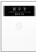
법구경(불타의 계승) 등하 엮음 법공량 | 9000원

팔리어로 되어있는 <법구경>은 처음 불교에 입문하려는 사람들에게는 더없이 좋은 안내서이며, 동시에 오래된 불자들과 구차 수행자들에게는 조밭심을 일깨우고 끊임없는 경책을 불러 일으키는 지침서이다. 이 책을 엮은 등하 스님은 1989년 송광사로 출가하여 현재 토굴에서 안거 수행중이다.