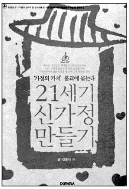
21세기 신가정 만들기 김중서 외 지음 도피안사 1만2000원

“반야를 배우고 부처님의 법을 배우는 사람들은 반야를 통해서 마음을 다스리고 가정을 다스려야 한다. 불법은 진리가기 때문에 믿고 행하는 그 사람과 가정과 사회에 밝음과 기쁨을 줄 것이다.”