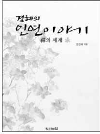
경계의 인연이야기 환경혜 지음 작가의 집 | 1만원

<경계의 인연이야기>는 위의 예처럼 성철 큰스님과 환경혜씨 엄마가 죽음을 놓고 선어로서 거래하는 문답 내용을 간추린 내용이다. 이 책은 23년간 매일 천 배의 절수