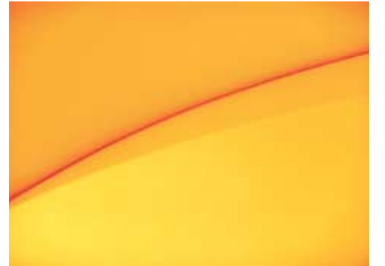
김상수 작 '2006 Tokyo'.

김상수씨는 "서울은 검은 돌의 기운과 파란색 기운이 수평으로 떠도는 느낌, 도쿄는 소독약 냄새가 나는 흰색으로 둘러싸인 컬러, 파리는 오래된 향수 냄새가 나는 보라색과 연회색이 푸른 기운을 띄고 있는 느낌"이라고 정의 내린다. 이번 전시는 김상수씨가 바라본 세 도시의 색을 공감해보는 기회다.