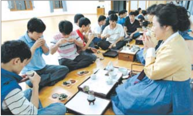
관문사 다도회 어머니 회원들이 새터민들에게 다도법을 설명하며 차를 함께 마시고 있다.

사회부장 무원 스님은 “여러분들이 낯선 사회에 안정적으로 정착하기까지는 문화적 차이에서 오는 갈등과 어려움이 도처에 도사리고 있을 것”이라며 “이를 극복해