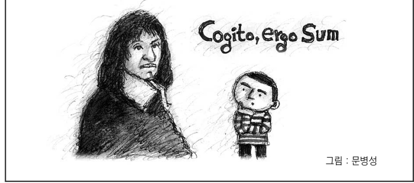
그림 : 문병성