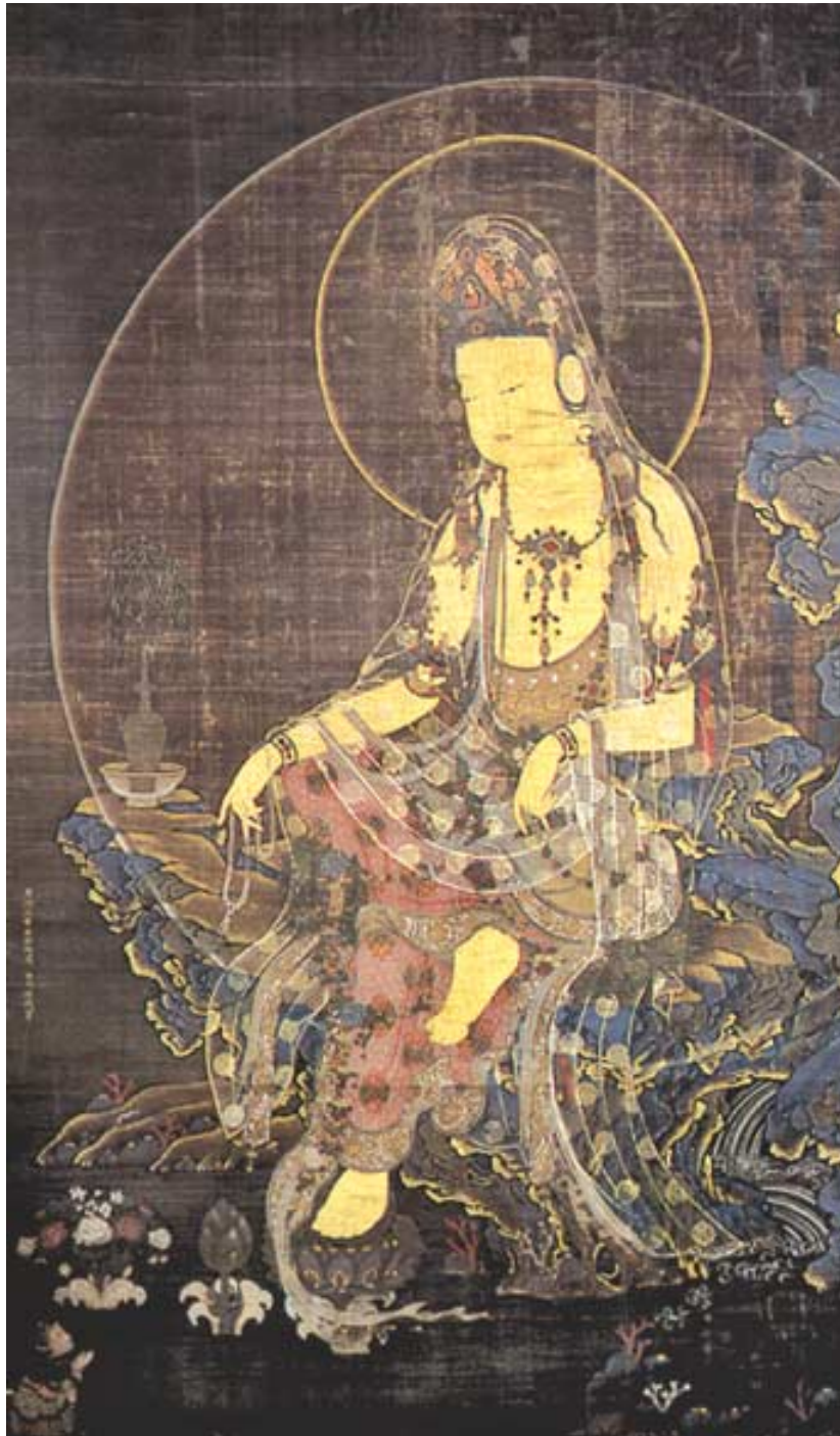
日 교토 천옥박물관(泉屋博物館) 소장 서구방필(徐九方筆) '수월관음도' (1323년, 충숙왕10년).

밤에 뒷산에 올랐습니다. 네온사인 환란한 도시의 밤이 발치 아래로 멀어져간 이후에야 달빛의 은은한 울림을 느낄 수 있었습니다. 차량의 소음이 아득히 사라진 뒤에야 달빛의 은화한 속삭임을 들을 수 있었습니다.