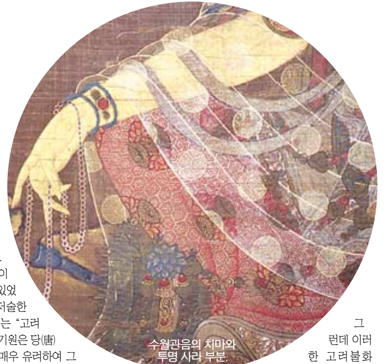
수월관음의 치마와 투명 사라 부분.

고려시대의 수월관음도는 '신묘(神妙)의 경지'라 칭송해도 과언이 아닐 만큼, 그 독자적인 고도의 '장인적 공교성(工巧性)'으로 이미 당시에 국제적인 정평을 얻고 있습니다. 원나라의 탕후(湯厚)가 저술한 '고금화감(古今畫鑑:외국화판)'에는 "고려의 관음상은 지극히 공교롭다. 그 기원은 당(唐)의 위치승에 두고 있지만, 필치가 매우 유려하여 그