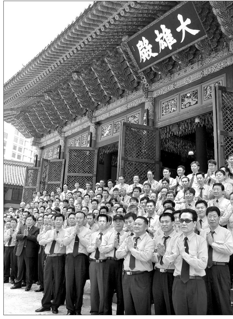
조계사가 주황색 와이셔츠 물결로 넘실었다. 사진은 법회를 마치고 기념촬영한 대구 운불련 회원들.

“여러분들은 달리는 법당의 범주이시죠? 그러면 무엇을, 어떻게 살아 날라야 제대로 신는 걸까요? ‘인사복덕(人施福德)’이라 했습니다. 사람에게 베푸는 보시가 제일 큰 복덕이라는 뜻이지요. 운전기사불자들은 사람을 실어 나르며, 그 분들에게 불법과 자비를 드러야 합니다. 그러려면, ‘대장경’을 실어 나르는 우직함 소처럼, 끊임없이 정진해야 합니다. 그래서 거리의 포교사가 될 수 있습니다. 알겠지요?”